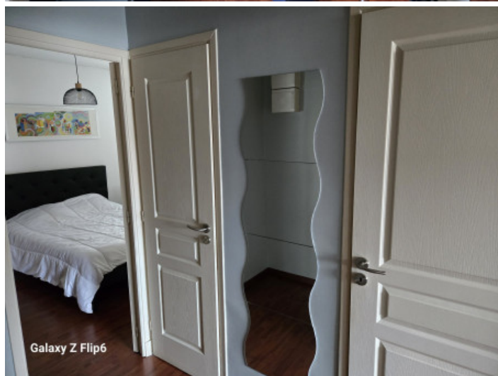
Galaxy Z Flip6