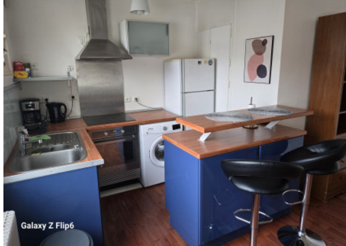
Galaxy Z Flip6