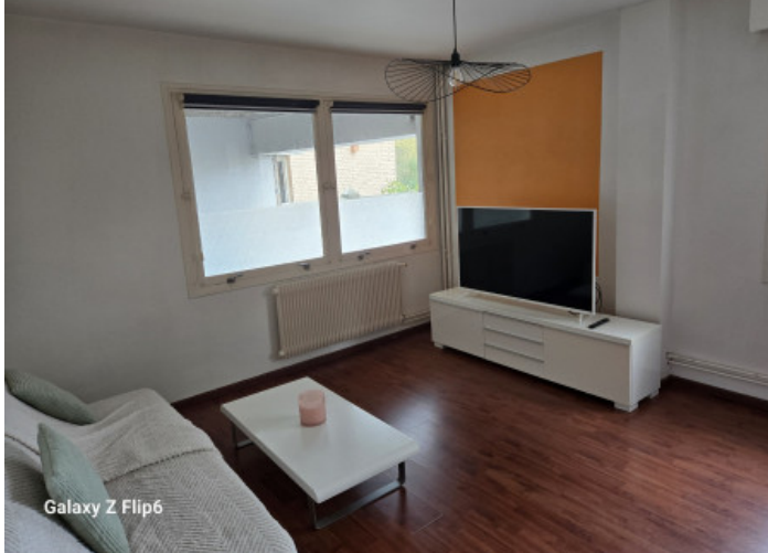
Galaxy Z Flip6