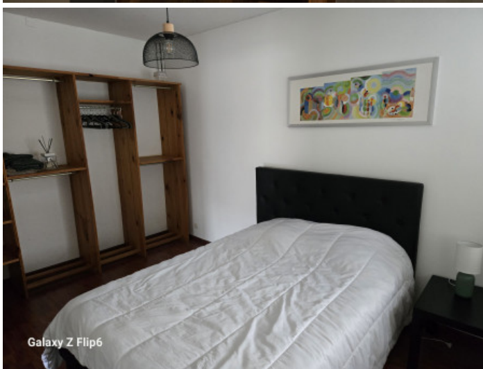
Galaxy Z Flip6