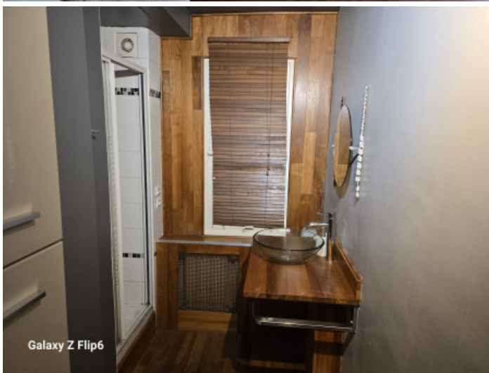
Galaxy Z Flip6